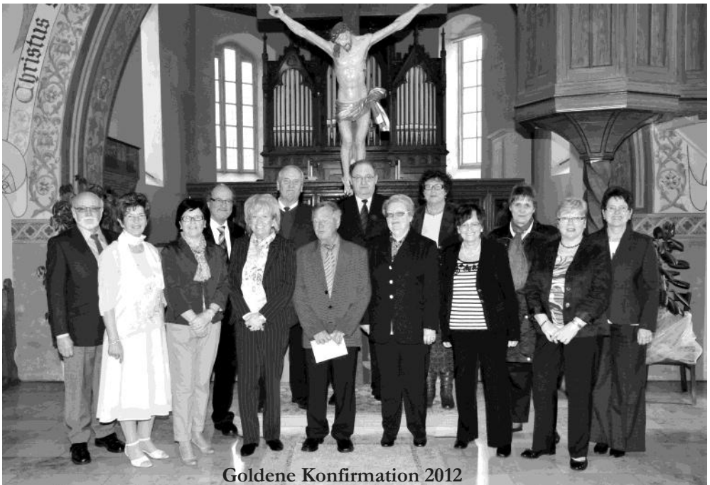
Goldene Konfirmation 2012